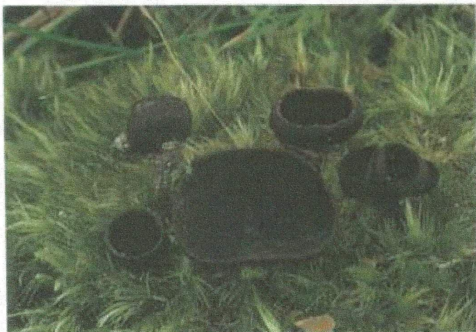
Fig. 1.- Plectania zugazae . Ascomas creciendo en ambiente húmedo, entre musgos. MA-Fungi 53068. Holotipo.

Holotypus: Hispania, Provincia Vallisoletana,